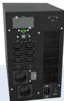
GALILEO T 3 kVA