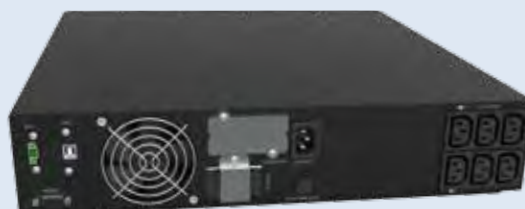
GALILEO RT 2/3 kVA