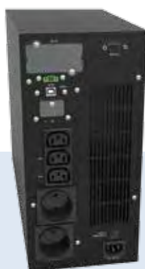
GALILEO T 2 kVA