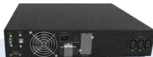
GALILEO RT 1 kVA