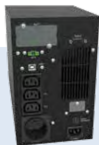
GALILEO T 1 kVA

*Tower **Rack/Tower ♦ Podmienky merania: optimalizované parametre, plne nabitá batéria, 0,7 PF