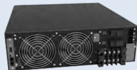
LEONARDO RT(3U) 10 kVA