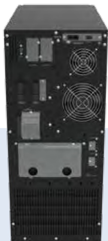
LEONARDO T 6/10 kVA

*Tower s internou batériou **Rack/Tower s internou batériou ***Rack/Tower bez internej batérie ♦ Podmienky merania: optimalizované parametre, plne nabitá batéria, 0,7 PF