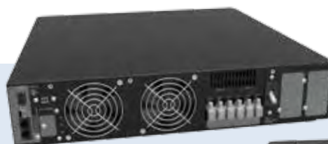
LEONARDO RT(2U) 6 kVA