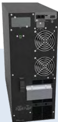
LEONARDO RT(4U) 6 kVA